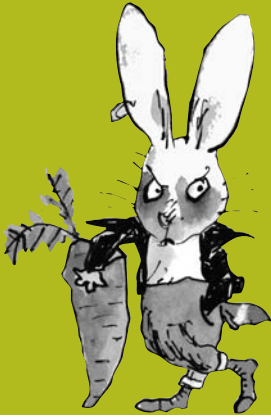
Le Vilain gredin, ill. T. Ross, Gallimard Jeunesse