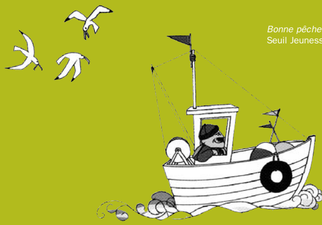
Bonne pêche, ill. T. Dedieu, Seuil Jeunesse