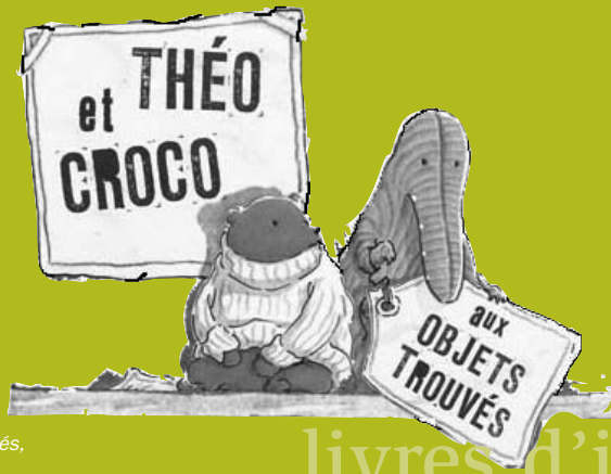
Théo et Croco aux objets trouvés, ill. J. Stewart, NordSud