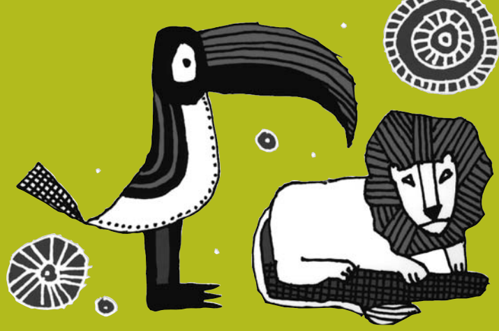
Le Lapin et le tigre, ill. C. Roux, Seuil Jeunesse

tons ocre donnant une allure générale d'un grand raffinement –, un bel amusement, une infinie satisfaction... (E.C.) ISBN 978-2-940317-49-3 14 €