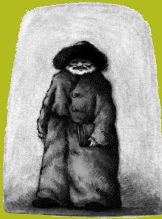
Le Trésor, ill. U. Shulevitz, Kaléidoscope