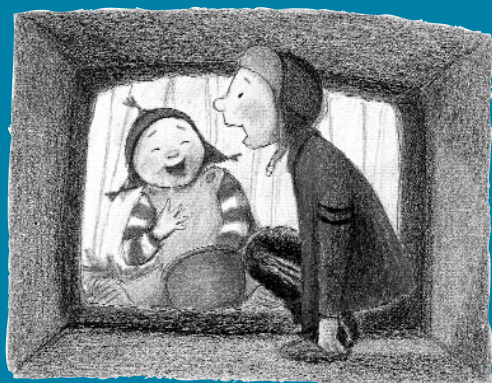
Le Jour où nous étions seuls au monde, ill. E. Eriksson, L'École des loisirs / Pastel