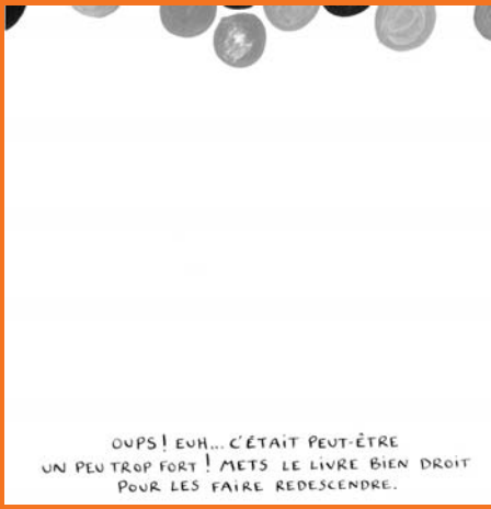
Un livre, ill. H. Tullet, Bayard Jeunesse