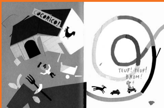
Ding dang dong !, ill. F. Bertrand, MeMo