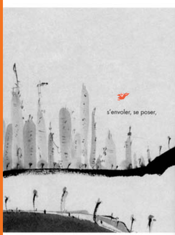
Un jour, ill. Yoo Ju-Yeon, MeMo