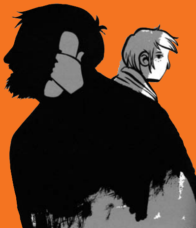
Paul Honfleur, ill. Alfred, L'Édune