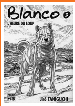
Blanco : L'Heure du loup, J. Taniguchi, Casterman