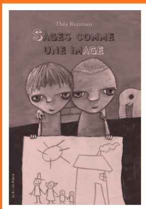
Sages comme une image, ill. T. Rojzman, Les Enfants rouges