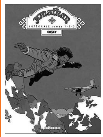
Jonathan, dess. Cosey, Le Lombard