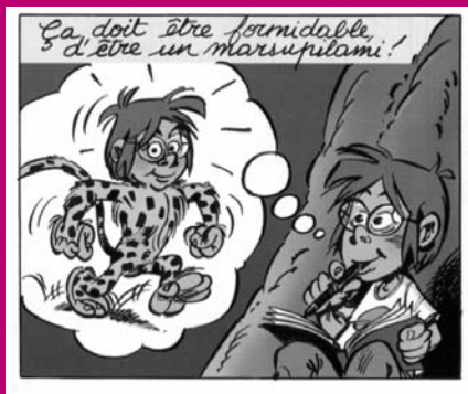
Marsupilami, t.23 : Croc vert, dess. Batem, Marsu Productions