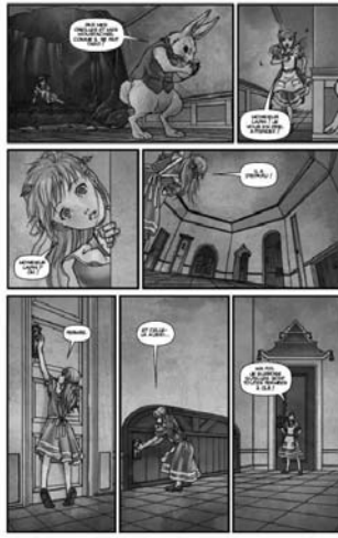
Alice au pays des merveilles, t.1 et 2, ill. E. Awano, Soleil