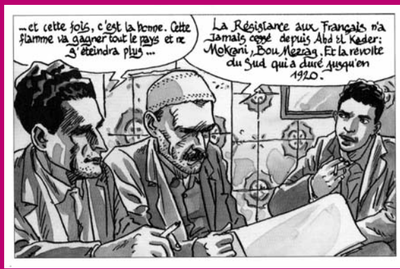
Des hommes dans la guerre d'Algérie, ill. J. Ferrandez, Casterman