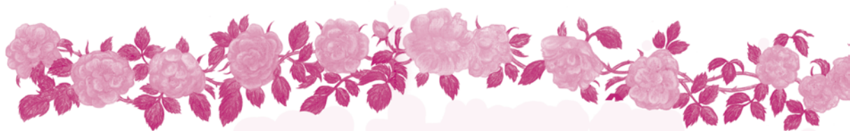
Des roses, Gulf Stream