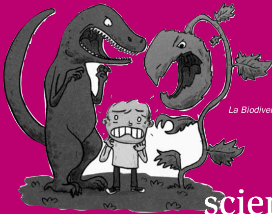
La Biodiversité, ill. B. Lebègue, Actes Sud Junior