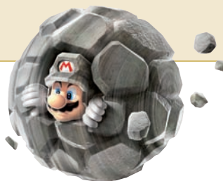
Super Mario Galaxy 2, Nintendo