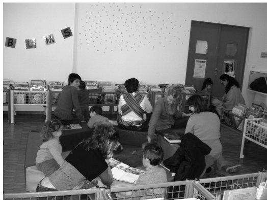
Espace Petite enfance de la Part-dieu