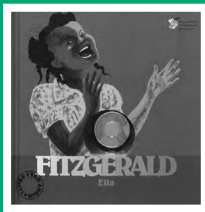
Ella Fitzgerald, Gallimard Jeunesse Musique