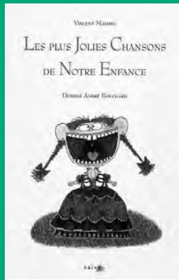
Les Plus jolies chansons de notre enfance, ill. A. Bouchard, Naïve