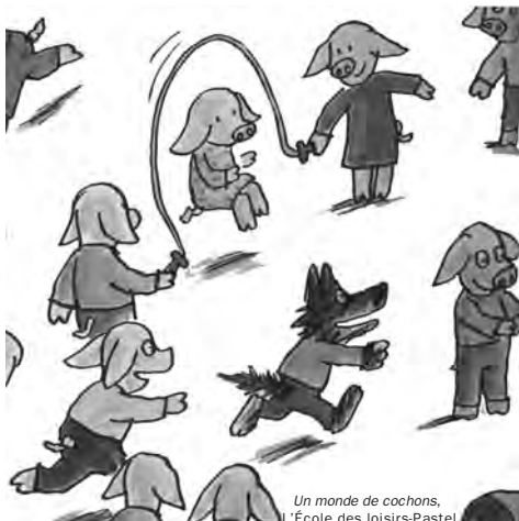
Un monde de cochons, L'École des loisirs-Pastel

« Nous sommes tous différents, mais nous nous ressemblons tous sur l'essentiel »