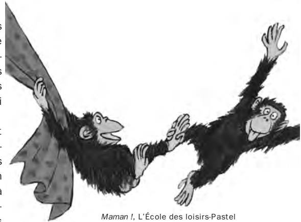
Maman I, L'École des loisirs-Pastel

« Une bonne narration n'est jamais quelque chose de simplet »