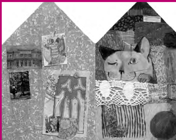
Toc toc toc, ill. A. Herbauts, Casterman