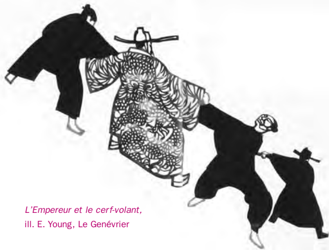
L'Empereur et le cerf-volant, ill. E. Young, Le Génévrier