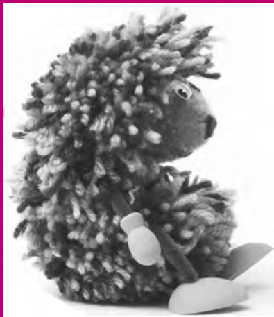
Pompons : à la campagne , C. Armani, Éditions D. Carpentier