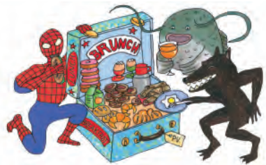
ill. in Lucullus Succulus