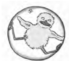
L'Album d'adèle, de Claude Ponti, Gallimard Jeunesse