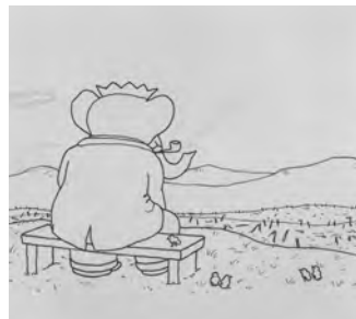
Jean de Brunhoff : Le Voyage de Babar , 1932 dessin à la plume inédit © Jean de Brunhoff BnF, Réserve des livres rares

Événements, rencontres, réflexions sur les pratiques professionnelles.