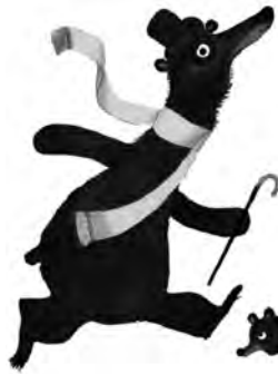
Une Chanson d'ours, de Benjamin Chaud, Hélium

Recension et analyse de plus de 200 nouveautés de l'édition jeunesse, classées par genres : livres d'images, contes, textes illustrés, premières lectures, livres-CD, romans, bandes dessinées, documentaires, multimédia, magazines pour enfants.