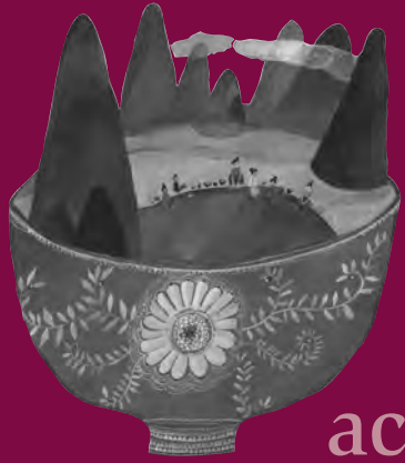
Une cuisine qui sent bon les soupes du monde, ill. A. Fronty, Rue du monde