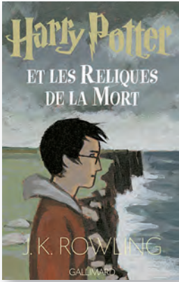
↑ J. K. Rowling: Harry Potter et les Reliques de la Mort, Gallimard, 2008.

réside à l'épicentre du Mal et du Bien ; en effet, juste sous la Bibliothèque s'ouvre l'une des bouches des enfers 22 , portail mystique par lequel le monde démoniaque fait retour dans celui des vivants ; savoir lire devient ainsi une question de vie ou de mort.