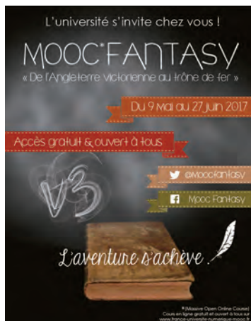
↑ Le MOOC Fantasy « De l'Angleterre victorienne au Trône de fer » de l'Université d'Artois.