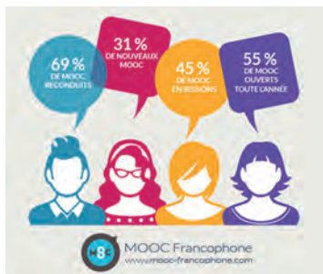
↑ Le portail MOOC francophone publie des enquêtes sur l'utilisation des Mooc.

Disponible durant une période de temps limitée, de 4 à 12 semaines, le MOOC propose de courtes séquences vidéo d'une dizaine de minutes et des activités pédagogiques variées, qui s'accompagnent de ressources en ligne (bibliographies, documentation). Des quizz et des travaux collaboratifs permettent de valider l'acquisition des compétences. Le MOOC est accessible à tout moment de la formation par le participant, qui peut suivre l'enseignement à son rythme. Un forum de discussion, souvent relayé par les réseaux sociaux, permet aux étudiants d'échanger et de favoriser l'évaluation entre pairs. Le MOOC est pensé comme une formation interactive : l'apprentissage est moins vertical, de l'expert vers l'apprenant, et davantage horizontal grâce aux échanges entre apprenants et avec l'équipe pédagogique.