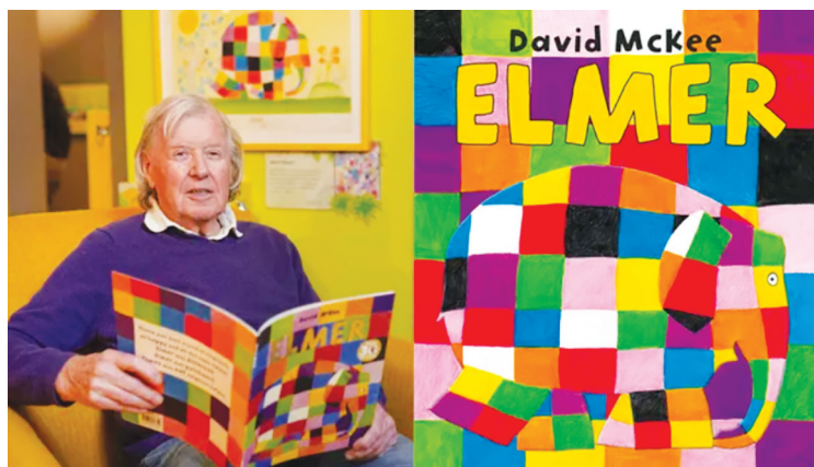
↑ © David McKee Seven Stories.