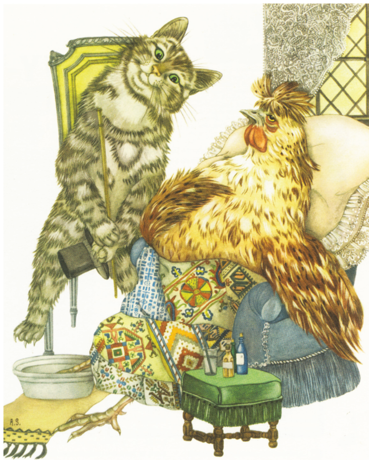
↑ Ill. Adrienne Ségur, in Mémoires d'images , n° 50.