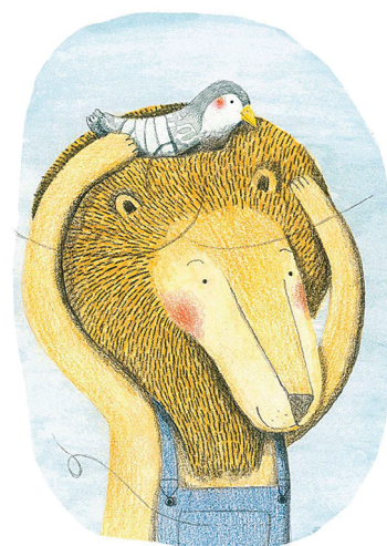
b. Tu n'auras pas froid ici.