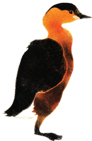
a. Grèbe roussâtre