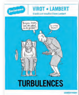
↑ Un des titres de la collection Sociorama chez Casterman