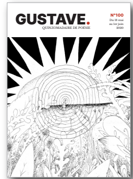
↑ Gustave, n° 100, du 18 mai au 1 er juin 2020.

Ma poésie brève n'a pas de recours. Pas de personnages inventés autres que soi, témoin d'une existence que l'on essaye de dire. Pas d'arcs narratifs ou de rebondissement pour rallier à sa cause. Juste un étonnement qu'elle s'efforce de provoquer en collant ensemble des termes qui n'ont pas l'habitude de se rencontrer. C'est le défi. Porter en quelques petits vers la langue à son degré de fusion, mais sans brûler personne. Faire croître ce feu dans une volonté de partage, pour nourrir notre rapport au monde.