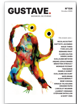
↑ Gustave, n° 104, octobre 2020.

Prendre garde à la trop grande ébullition. Surveiller avec tendresse ces mots qui sortent. Comme le lait sur le feu. Ne servir que la portion juste. Sans jamais combler l'appétit du convive. Le poème bref requiert d'opérer un double processus de décantation et d'élimination. Décantation de ces mots jetés au