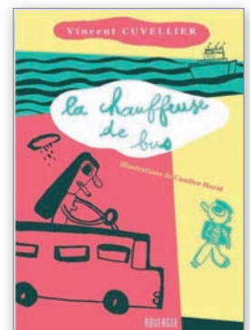
↑ Label 4 chouettes 2004.