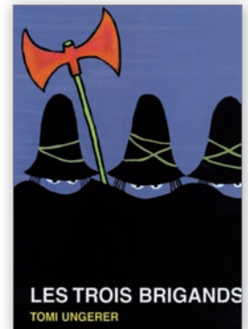
↑ Label2 chouette 1992.

2. Le soutien des bibliothèques publiques de Wallonie et de Bruxelles au Prix Bernard Versele est double. Quinze d'entre elles participent aux phases de présélection en achetant les livres pour les rendre disponibles aux bénévoles lecteurs. Et une fois la sélection de l'année opérée, elles sont quasiment 600, réparties en 14 réseaux de lecture, à diffuser auprès du jeune public les 25 livres en lice, certaines consacrant une belle énergie à organiser séances de lecture et animations en rapport avec le prix.