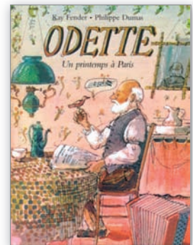
↑ Label 2 chouettes 1979.