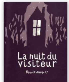
↑ Label 3 chouettes 2011.