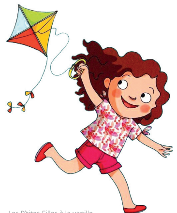
Les P'tites Filles à la vanille

Les P'tites Filles à la vanille n° 162, avril 2021