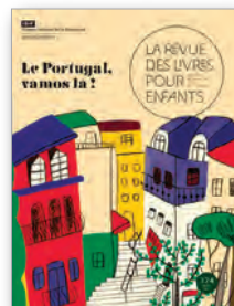
Illustration de © Catarina Sobral, extraite de Coimbra , © Pato Lógico, 2019 (A minha cidade). Reproduite avec l'aimable autorisation de l'autrice et de son éditeur.